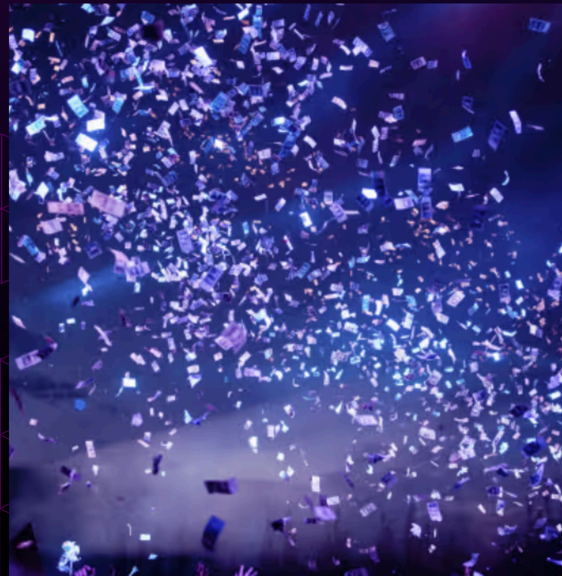
STARTUPS & SCALEUPS