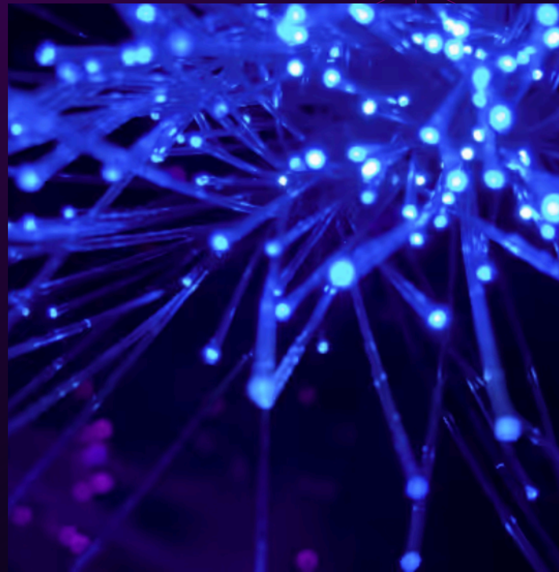
PEOPLE & COMPANY BRANDING