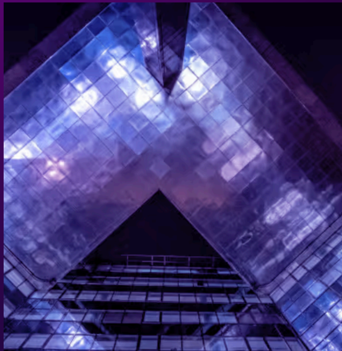
EVENTS & NETWORKING